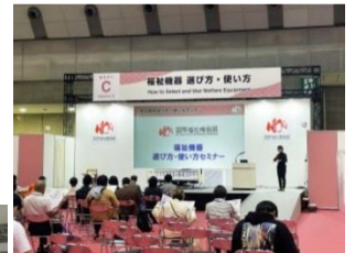
福祉機器の選び方・使い方 セミナー