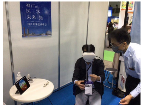
体験している様子