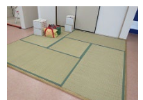
びわこリハの施設 和室