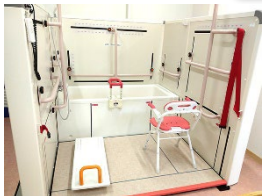
入浴介助実習のための施設

VRを使った授業では、「リハビリをする本人だけでなく、その体験している人を周りから見ることで、動作分析などといった練習にも使えるのではないかと思った。」「実際に体験してみると、結構身体全体を使えるし、楽しかったのでゲーム感覚でリハビリができて良いと思った。」といった感想がありました。 皆さんの卒業後の活躍が楽しみです！